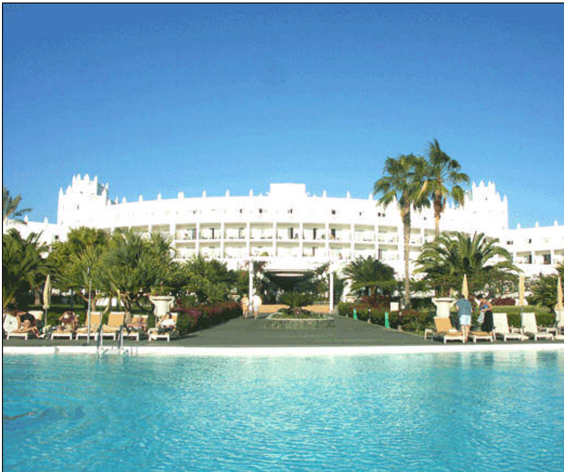
In elegantem Karibik-Weiß präsentiert sich das ****Riu Palace Meloneras