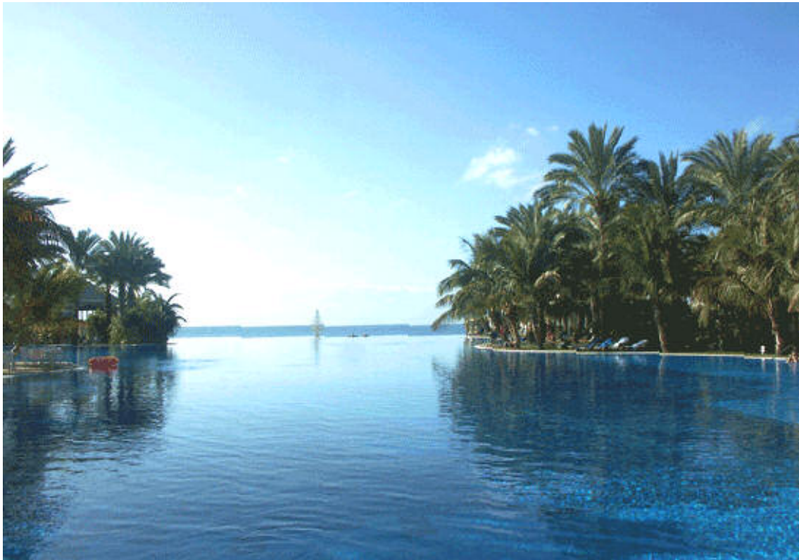
Resort, Spa & Casino Lopesan Costa Meloneras kokettiert mit dem schönsten Palmengarten und dem 100-Meter-Swimmingpool, das optisch ins Meer fließt