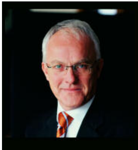
Ministerpräsident Jürgen Rüttgers