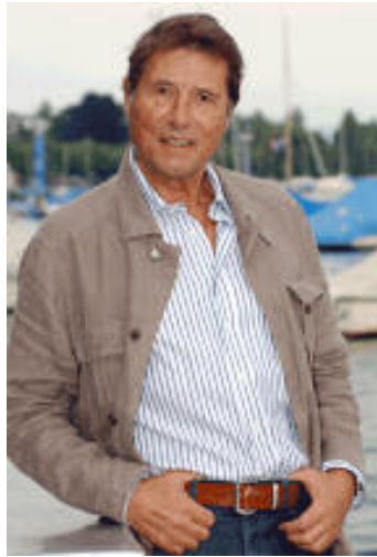
Prof. Udo Jürgens