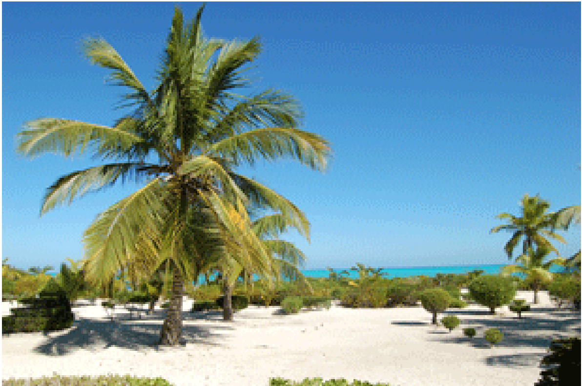
Von der Villa Bahr: Paradiesischer Ausblick auf Meer, Strand und Palmen